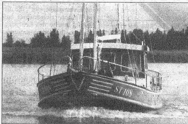
„Schwimmender Ü-Wagen“ und Streitobjekt: Arbeits- und Forschungskutter „Pirrol“